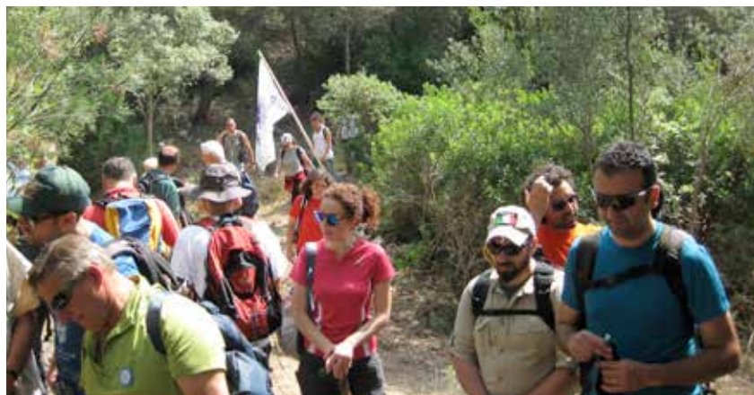
I corsisti in azione nella gravina di Pentimelle (Montecamplo)

Parole d'ordine formazione ed esperienza; per questo il corso si è diviso in due parti: la prima di natura teorica svolta nel Museo Valentino, durante la quale gli istruttori hanno illustrato ai corsisti le caratteristiche che un sentiero censito dal Cai deve necessariamente avere (specificando la segnaletica e gli interventi di messa in opera e manutenzione degli stessi) e la seconda, direttamente sul campo, mediante la