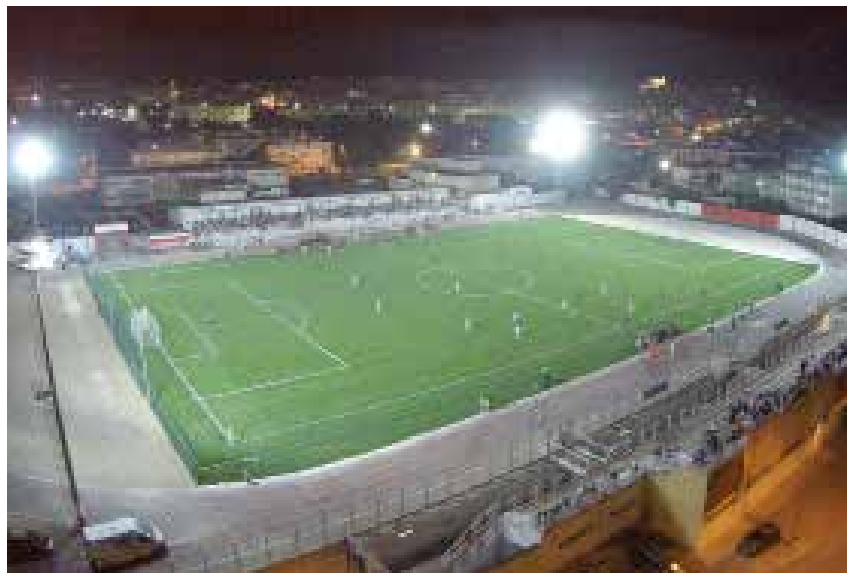
Panoramica aerea del nuovo manto in erba sintetica

La strada è sicuramente quella giusta: il grande successo di pubblico registrato proprio durante gli incontri dell'edizione 2015 dello Scirea Cup (tornato a Castellaneta a furor di popolo) non è altro che la